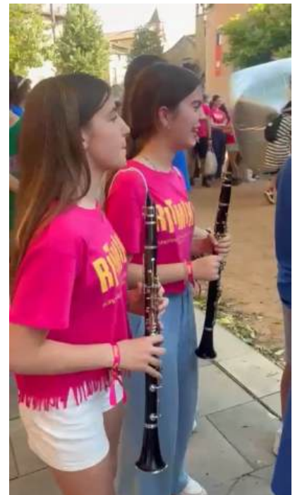
Alumnes de l'EMMú cantant i tocant durant el RITMIKS