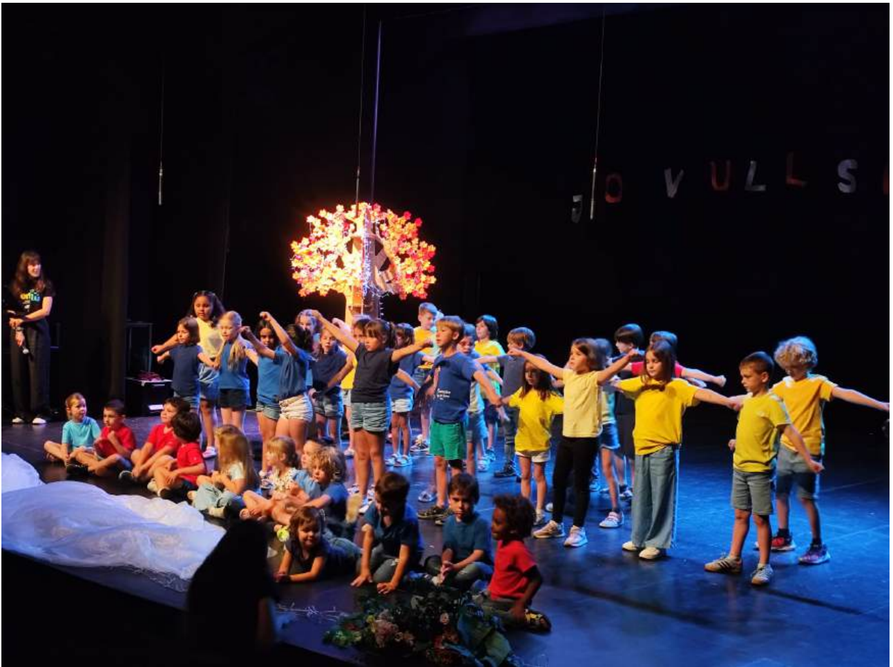
Alumnes de la coral de Sensibilització i Formació Bàsica 1 i 2 al concert de final de curs al Teatre Narcís Masferrer de Sant Feliu de Guíxols

Van preparar la cantata “Els cinc sentits” escenificada i coreografiada, amb un attrezzo molt ben treballat per a l'ocasió.