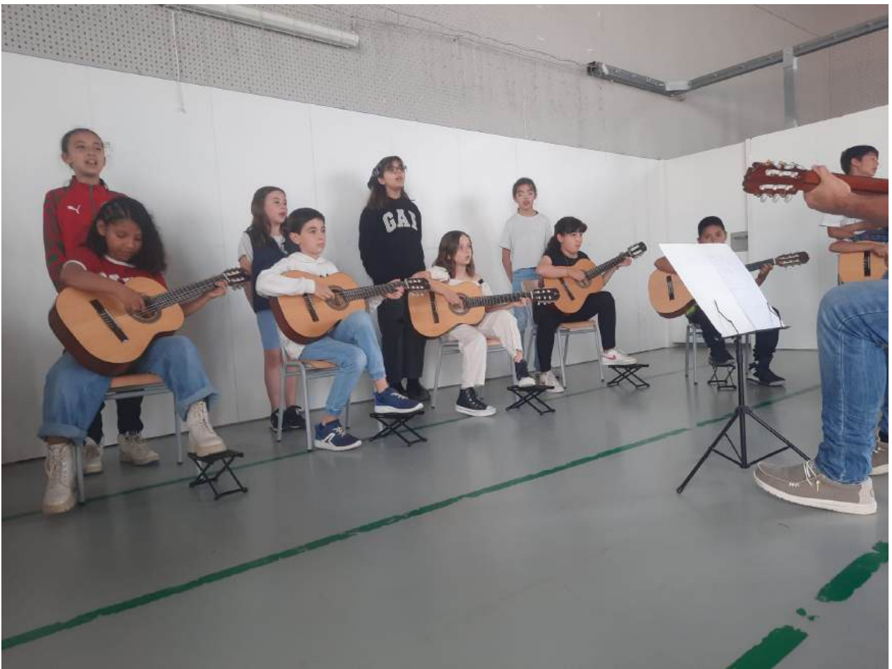
Alumnes de l’Escola Ardenya durant el seu últim concert al poliesportiu de l’escola

Els alumnes de l’Escola Ardenya de Sant Feliu de Guíxols van realitzar el seu concert de final de curs al mateix centre de primària. Durant aquesta activitat, els professors del centre i les famílies dels alumnes van poder apreciar la gran feina que es fa durant tot el curs amb aquest projecte de música comunitària.