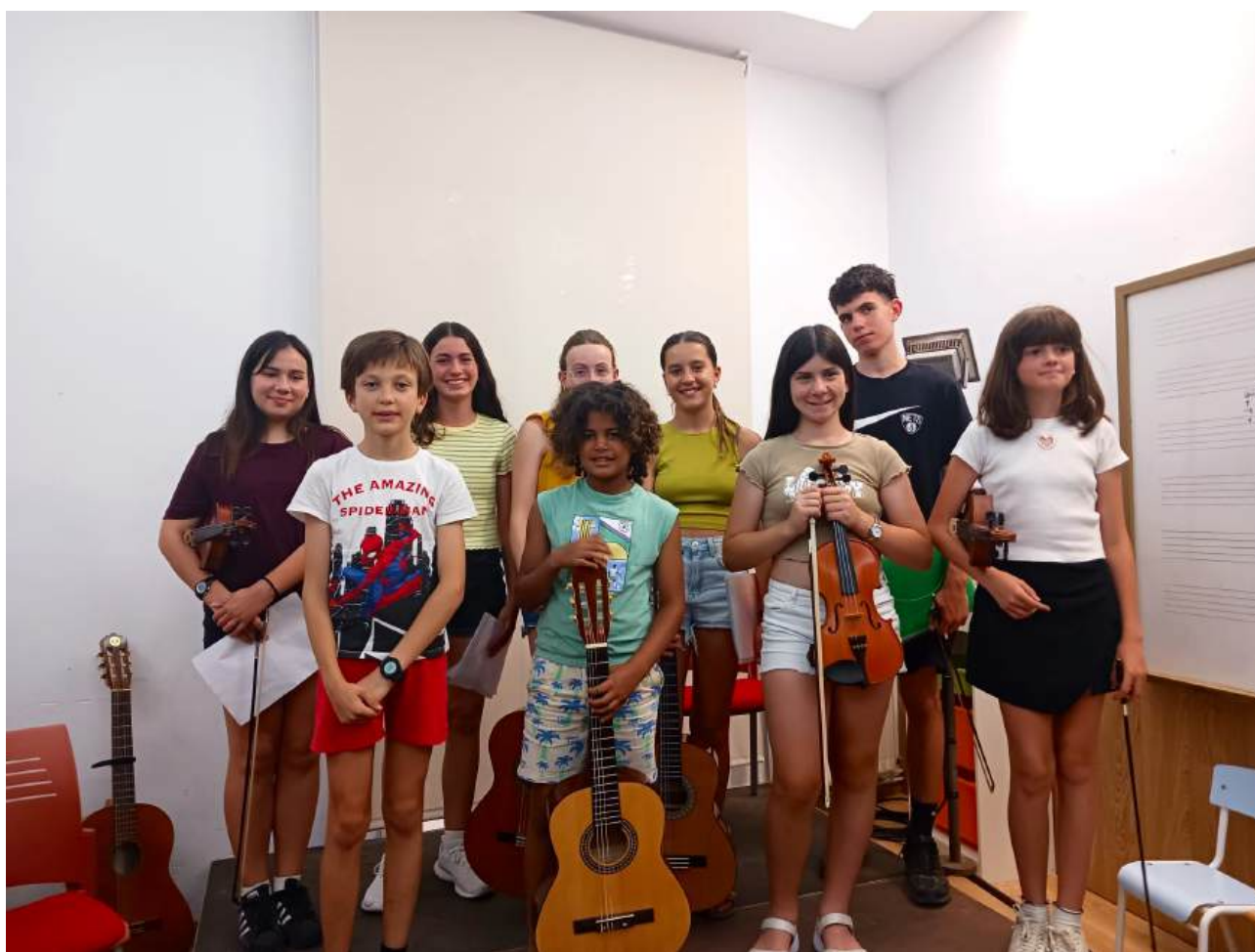
Alumnes de l'EMMú Guíxols Vall d'Aro després del seu MICROCONCERT

Per segona i última vegada durant aquest curs, durant la segona setmana de MICROCONCERTS es van realitzar les audicions individuals i col·lectives dels alumnes de l'EMMú. De nou, es van fer dues sessions de dilluns a dijous a dues aules de l'escola, i una única sessió el divendres, on també hi van participar els alumnes d'instrument complementari.