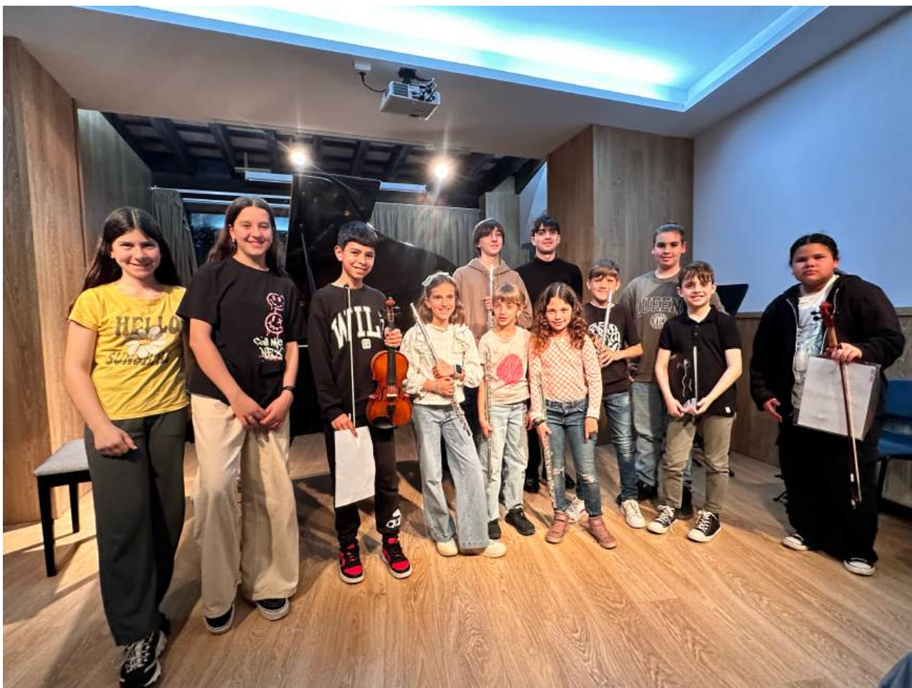
Única fotografia realitzada dels alumnes que van tocar en aquest l'ESCENARI OBERT sense pantalles

En aquesta ocasió la proposta va ser "SENSE PANTALLES": totes les famílies estaven avisades prèviament que en aquesta audició venien a gaudir i a escoltar, sense treure el mòbil durant el concert. Una proposta molt ben rebuda de donar valor al què fan els alumnes i centrar tota l'atenció a escoltar-los.