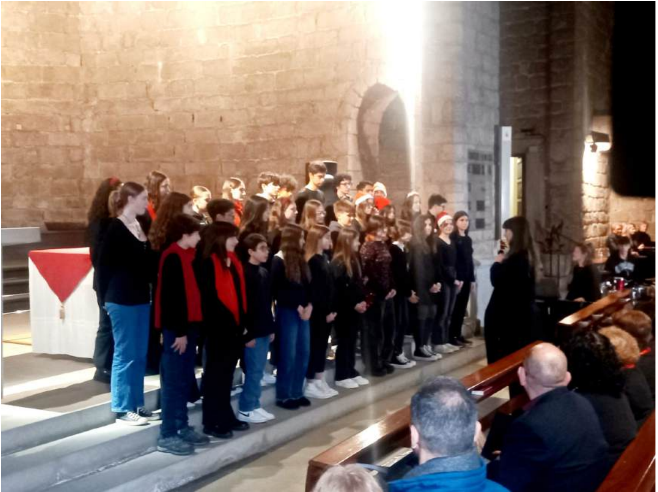
Alumnes de la Coral de Formació Avançada i Nivell Mitjà cantant al Monestir de Sant Feliu de Guíxols

Any rere any, el divendres abans de Nadal se celebra un concert amb totes les corals de Sant Feliu de Guíxols, on els alumnes de la Coral de Formació Avançada i Nivell Mitjà hi participen amb el seu repertori.