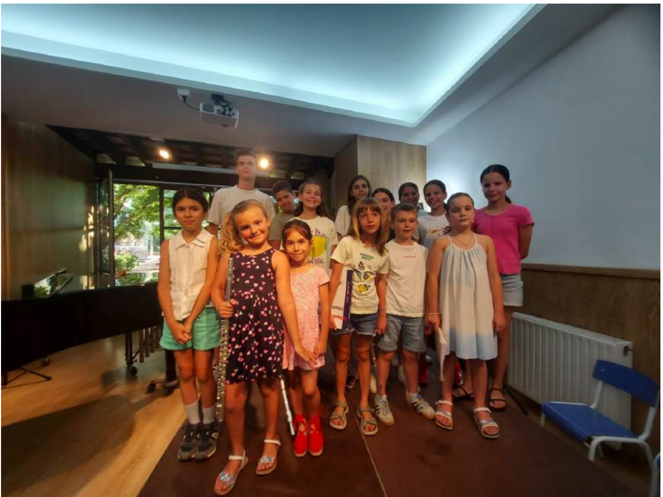
Alumnes de l'EMMú Guixols Vall d'Aro després de les audicions individuals

Un cop passats els últims concerts i audicions individuals es fan arribar els informes d'avaluació a les famílies. Es recomana a tots els professors convocar tutories per tal de poder fer un tancament apropiat del curs, donar la feina d'estiu i enfocar els objectius pel curs vinent.