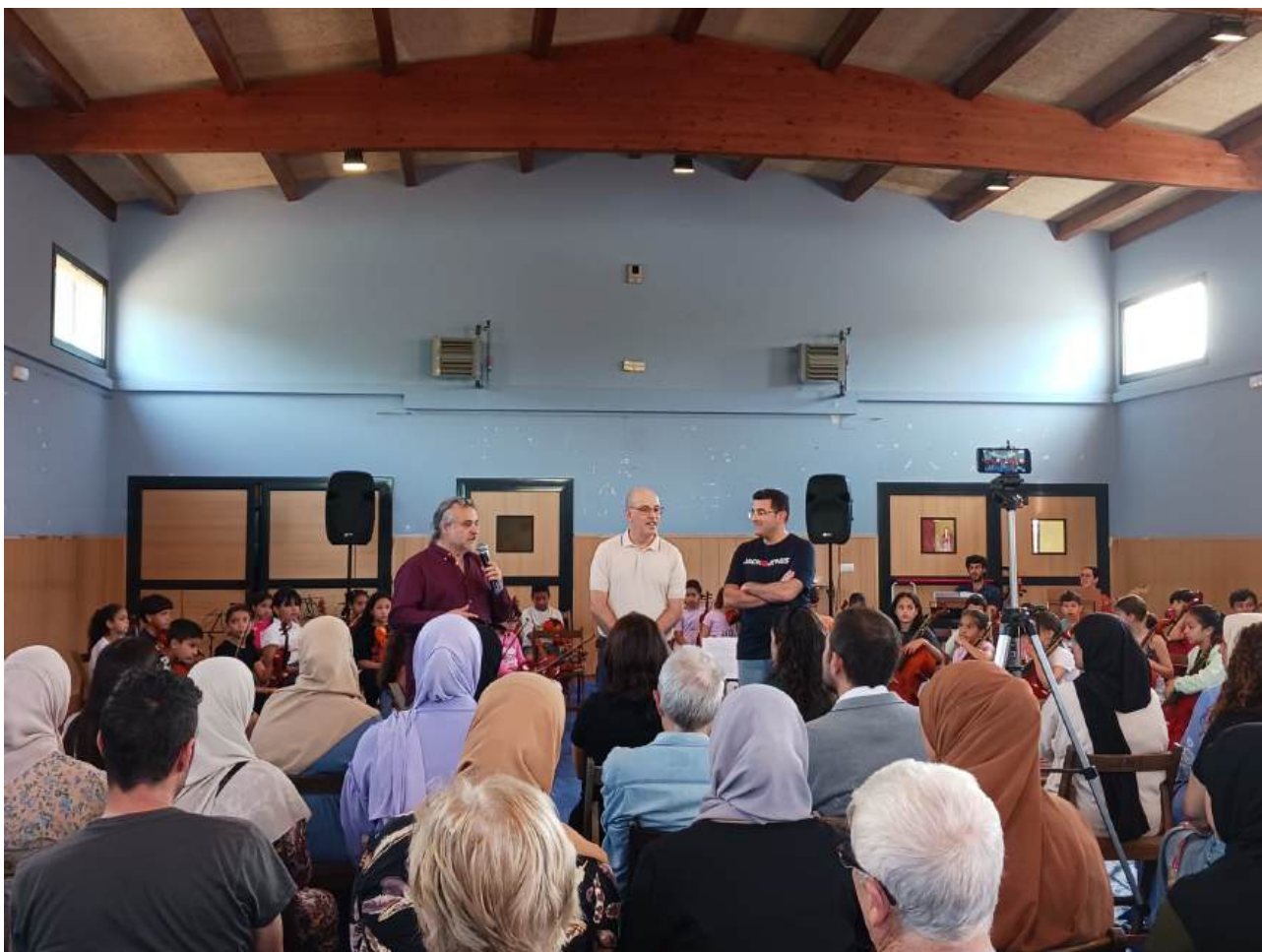
Poliesportiu de l’Escola Baldiri i Reixach durant el concert de final de curs del projecte de música comunitària “Juguem amb cordes”

El projecte de música comunitària “Juguem amb cordes” de l’Escola de primària Baldiri Reixach va realitzar el seu segon i últim concert del curs al pavelló de l’escola. Tot un esdeveniment orquestral on els alumnes van tocar acompanyats dels professors de corda.