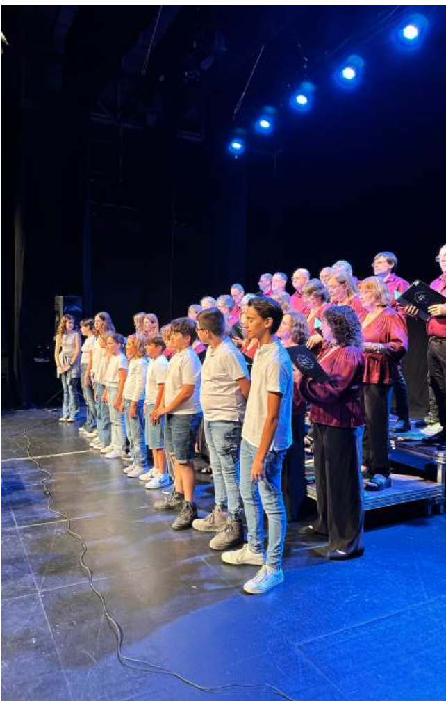
Fotografia dels alumnes de l'EMMú cantant amb la coral Cypsella al Teatre Narcís Masferrer de Sant Feliu de Guíxols

Arrel de la participació de l'EMMú Guíxols Vall d'Aro a l'últim enregistrament de la sardana l'any 2021, la Coral Cypsella va demanar la col·laboració dels alumnes de l'Escola. No només hi van participar als alumnes actuals, sinó també els exalumnes que en el seu moment van participar a l'enregistrament.