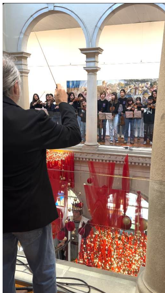
Alumnes de l'EMMú durant el concert itinerant de Nadal