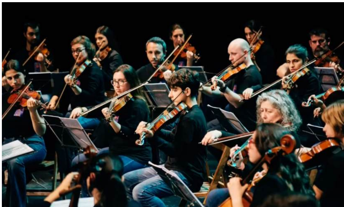
Fotografia dels alumnes al concert i logo del 30è l'aniversari de l'Orquestra de corda

L'Orquestra de Corda va celebrar el seu 30è aniversari amb la participació d'alumnes i exalumnes de corda de l'EMMú Guíxols Vall d'Aro. Després de realitzar una sèria d'assajos previs a l'Escola de Música, el concert es va realitzar al Teatre Auditori Narcís Masferrer, on tots els participants van portar una samarreta amb el dibuix que es va encarregar expressament per a l'ocasió.