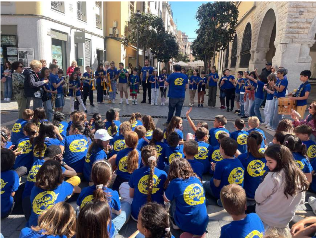
Alumnes de l’Escola de Cobla de l’Escola Gaziel a la Rambla de Sant Feliu de Guíxols mentre se celebra el concert itinerant

Una vegada més, el projecte de música comunitària “Escola de Cobla” de l’Escola de Primària del Gaziel va sortir a tocar pels carrers de Sant Feliu de Guíxols al llarg del matí, realitzant així dos concerts itinerants durant el curs escolar.