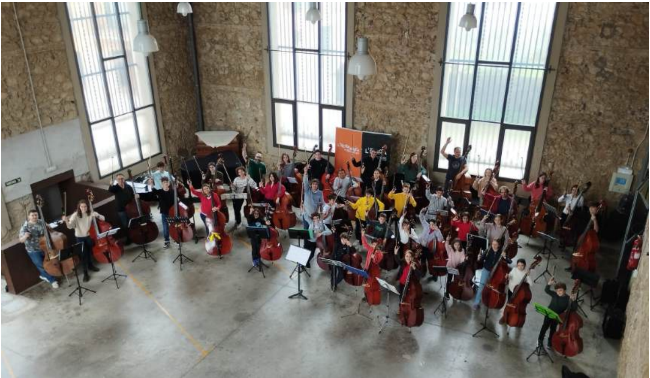
Alumnes participants a la Contrabaixada 2025 a l'edifici l'Energia de Palafrugell

Una dotzena d'Escoles de Música de la província han aconseguit reunir una quarentena de joves contrabaixistes durant una jornada musical complerta que va finalitzar amb un concert a Palafrugell.