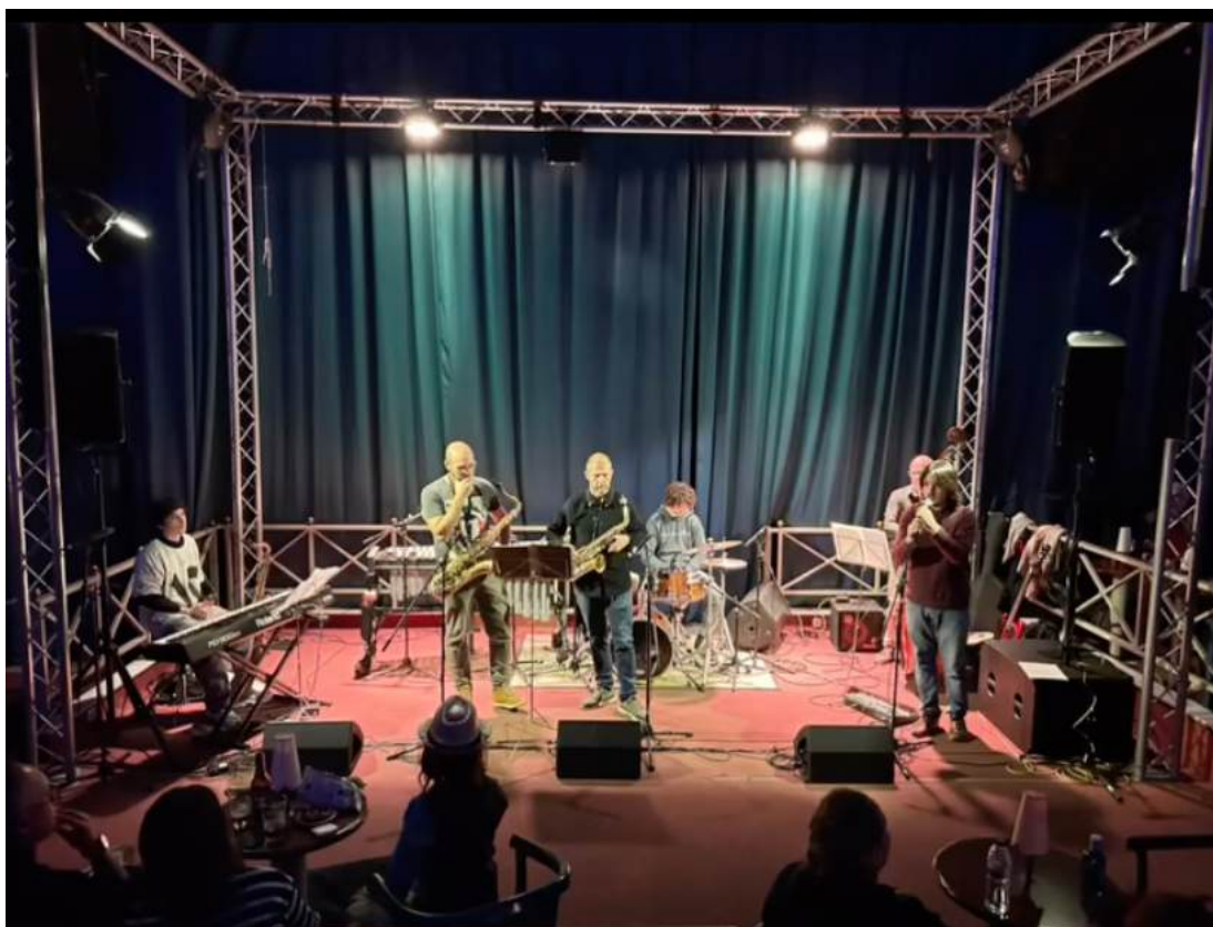
Alumnes del Combo Sénior a la JAM Session a la Sala 2 de la Sala “Las Vegas”

Durant el curs escolar s’organitzen dues JAM Sessions a la Sala “Las Vegas” de Sant Feliu de Guíxols, on no només hi participen els professors de moderna de l’EMMú Guíxols Vall d’Aro, sinó també els alumnes de combos i alumnes lliures.