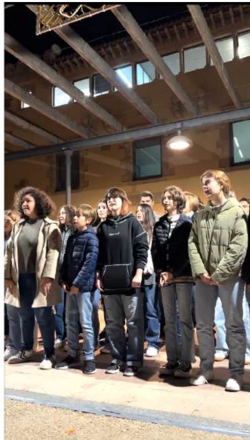
Alumnes de les corals de l'EMMú cantant a la Plaça de l'Ajuntament de Sant Feliu de Guíxols