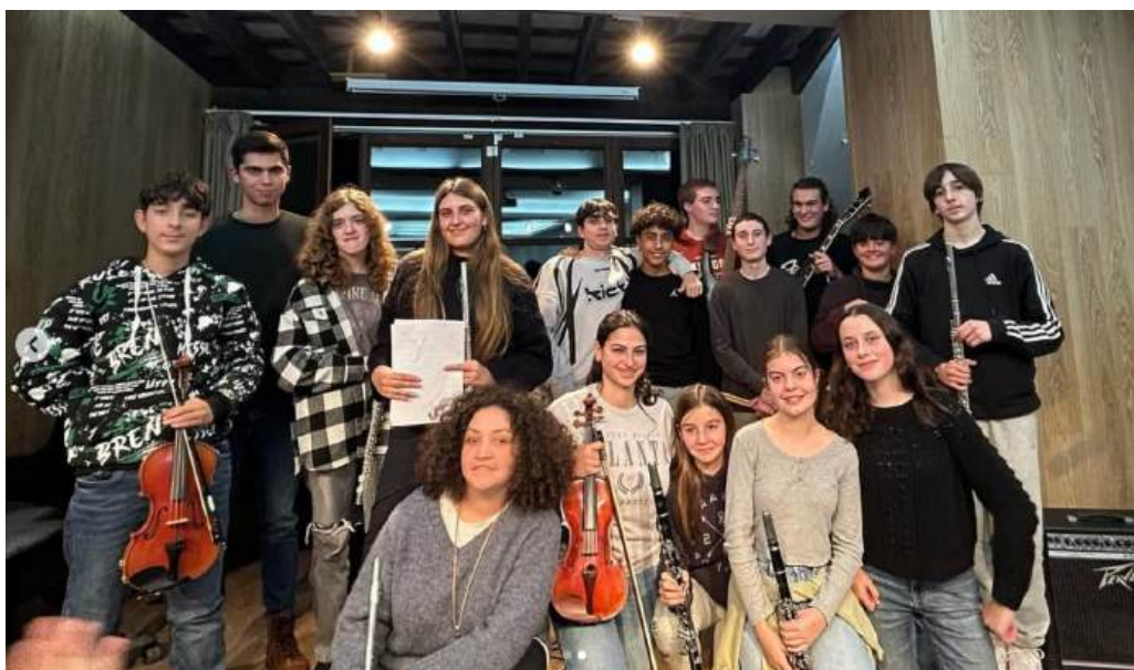
Fotografia dels alumnes participants a l'ESCENARI OBERT benèfic per la DANA

En aquesta ocasió, la proposta es va unir a les Escoles de Música afectades per la DANA, realitzant així un concert benèfic que donés la possibilitat als oients de fer donacions a través dels comptes proporcionats per l'Ajuntament de Sant Feliu de Guíxols, o bé directament en metàl·lic a la caixa que es va deixar a l'entrada de l'Auditori. Aquesta iniciativa va tenir una molt bona rebuda i els diners que es van recollir en metàl·lic es van enviar al dia següent al compte creat per les Escoles de Música de la Comunitat Valenciana que havien estat afectades pel desastre.