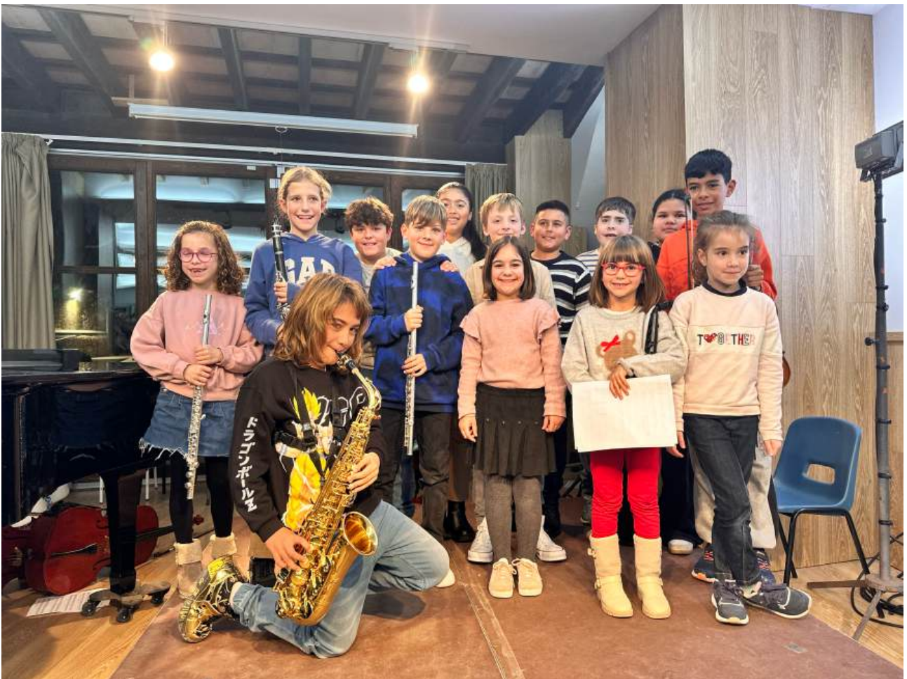
Alumnes de l'EMMú després de realitzar la seva audició individual als MICROCONCERTS

Si els professors/es de llenguatge musical creuen convenient fer algun comentari individualitzat, s'ha de comentar amb el tutor per tal que faci arribar les informacions pertinents a les famílies.