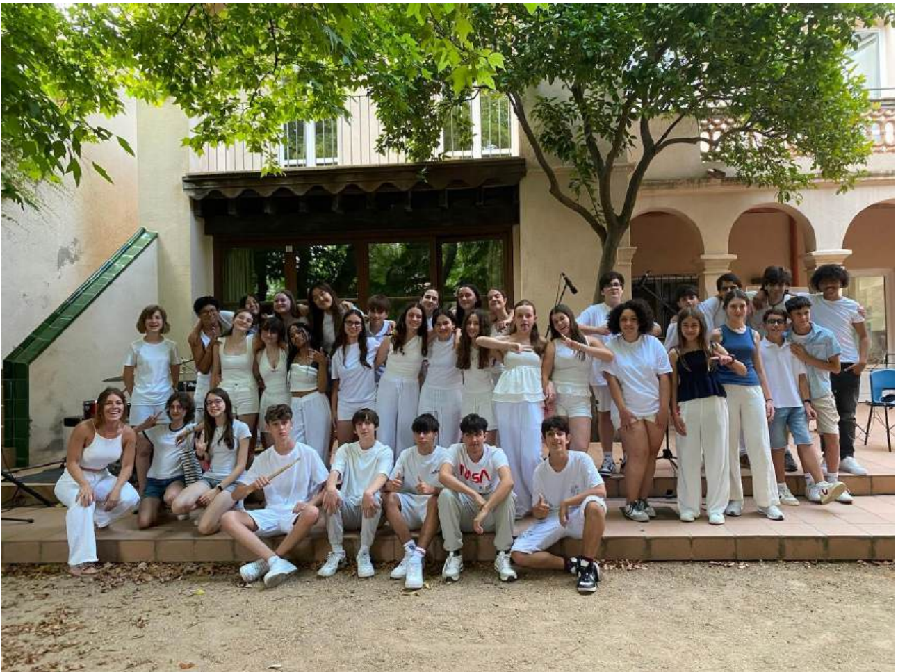
Alumnes de Combo i de la Coral de Formació Avançada i Nivell Mitjà després del concert

Tan els alumnes de combo com els de la coral dels grans també van voler realitzar un concert únic per finalitzar el curs al pati de l'escola de música. Tot i haver participat recentment al Festival RITMIKS i haver realitzat el concert de les tres escoles, tenien bon material per oferir al públic i a les famílies, fet molt positiu per als alumnes.