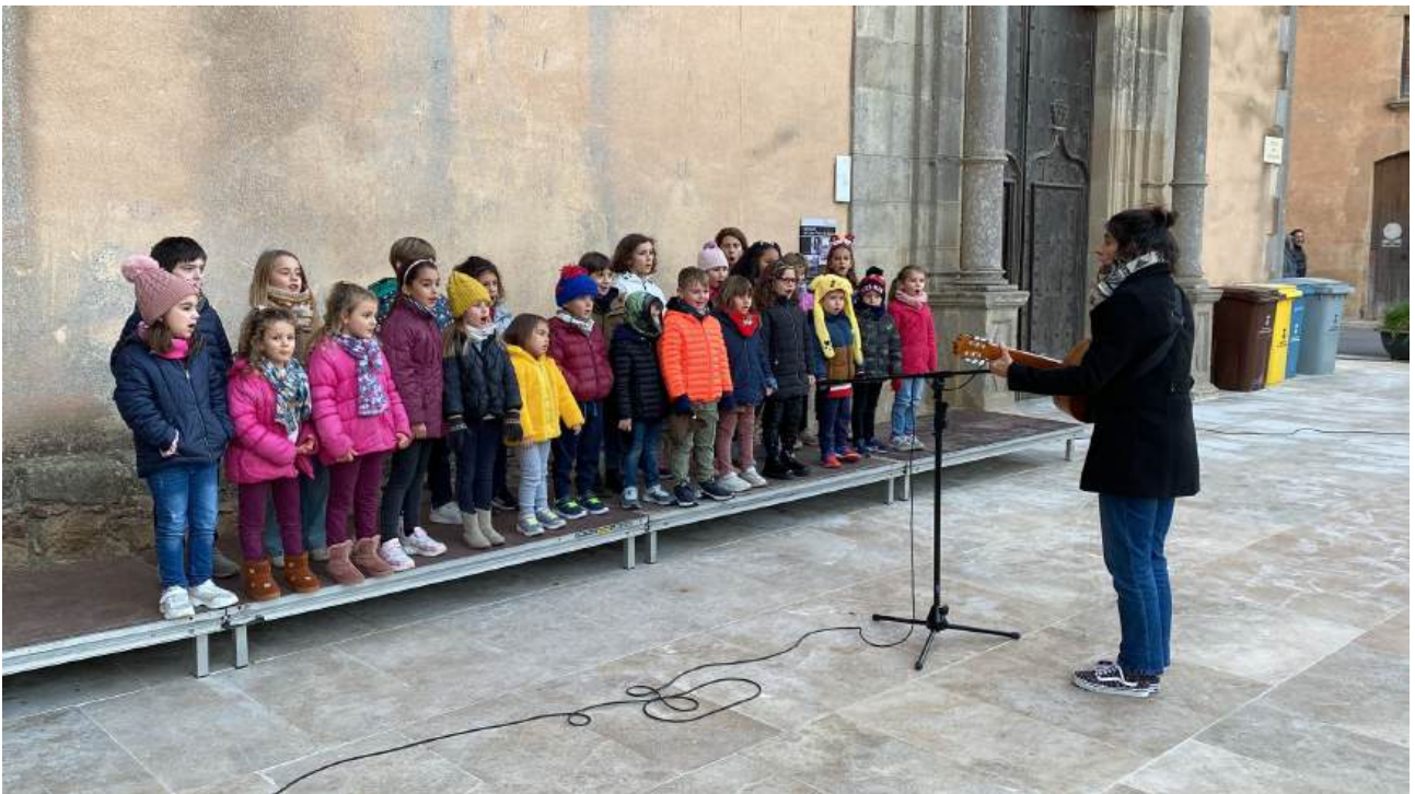
Fotografia dels alumnes de Sensibilització i Formació Bàsica 1 i 2 a la inauguració del pessebre davant del Monestir de Sant Feliu de Guíxols

El mateix dissabte a la tarda es va realitzar la inauguració del Pessebre, on van cantar els alumnes de la coral de Sensibilització i Formació Bàsica 1 i 2 davant del Monestir. És una de les activitats de Sant Feliu de Guíxols on els alumnes de l'EMMú Guíxols Vall d'Aro hi participen anualment i on el públic pot gaudir d'un petit concert a càrrec dels alumnes més petits de l'escola.