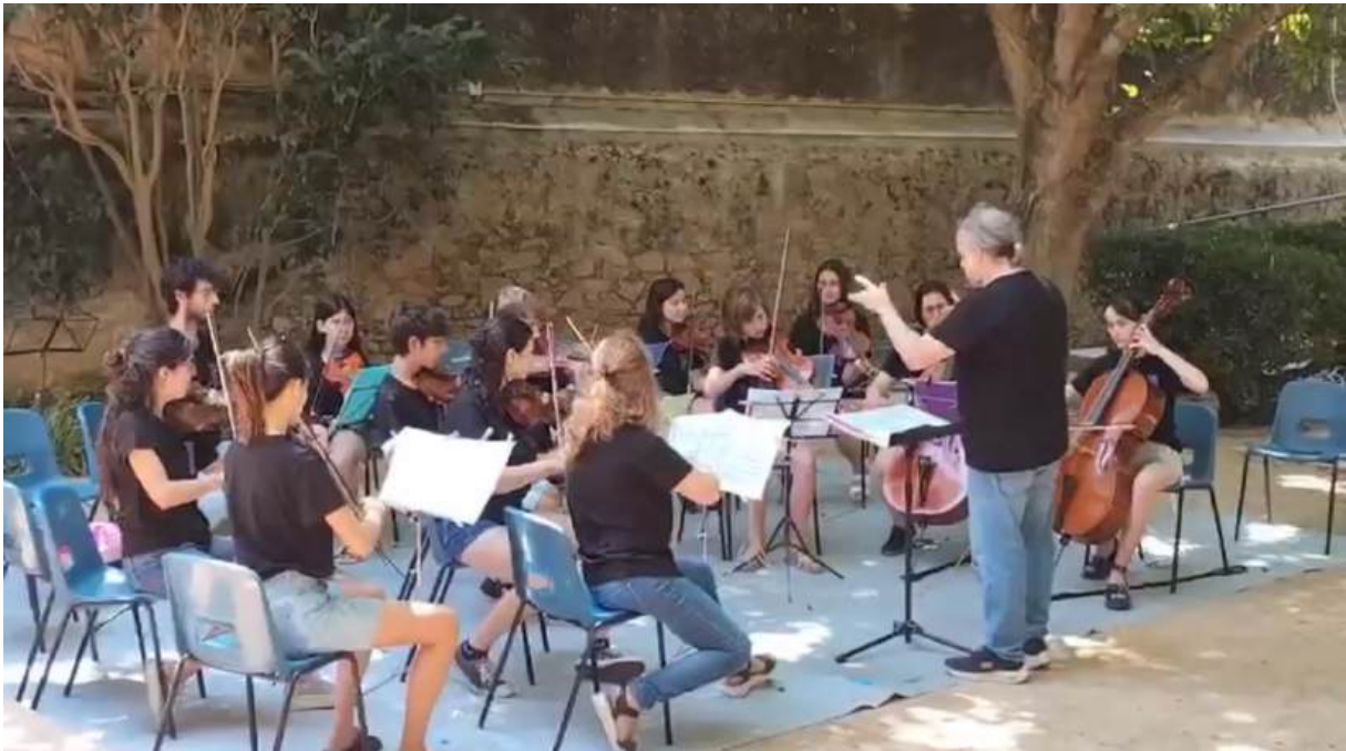
Alumnes de l'orquestra de corda de l'EMMú Guíxols Vall d'Aro durant l'últim concert al pati de l'Escola de Música

Aprofitant que el Dia Internacional de la Música és el 21 de juny i que aquest 2025 va caure en dissabte, dia que l'orquestra assaja setmanalment, es va realitzar l'últim concert de l'escola. Un concert que va durar una hora i que va ser tot un èxit, donant així per finalitzat el curs.