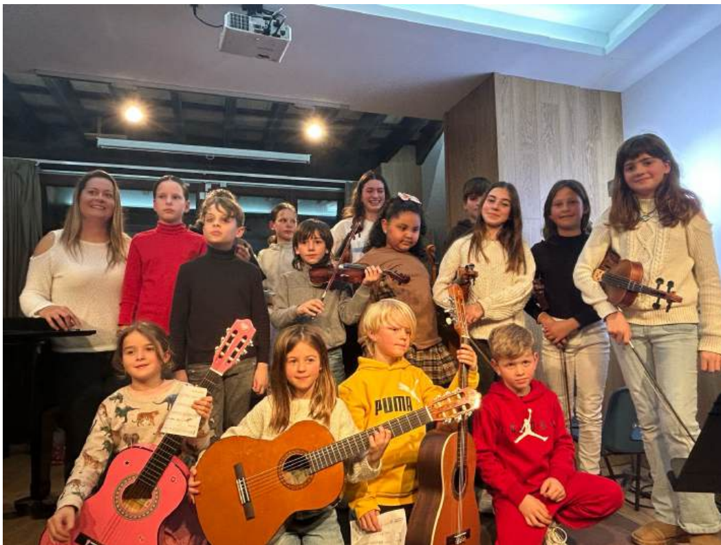
Alumnes participants als MICROCONCERTS del mes de febrer

Durant els dies de la setmana que hi ha més alumnat, s'organitzen dos concerts de forma simultània a la mateixa escola, ocupant l'Auditori i l'aula 1.1. És una bona forma que els alumnes i les famílies puguin escoltar als altres alumnes de l'escola en franges inferiors a una hora.