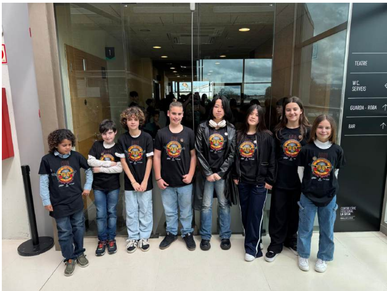
Alumnes de guitarra de l'EMMú Guíxols Vall d'Aro amb la samarreta de la Guitarrada

El concert es va realitzar el cap de setmana següent al Centre Cívic i Cultural "La Sitja" de Fornells de la Selva, amb una participació d'uns 70 estudiants de guitarra.