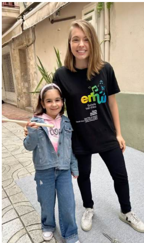
Alumnes provant el violí i la flauta travessera durant l’activitat “Prova un instrument” al carrer