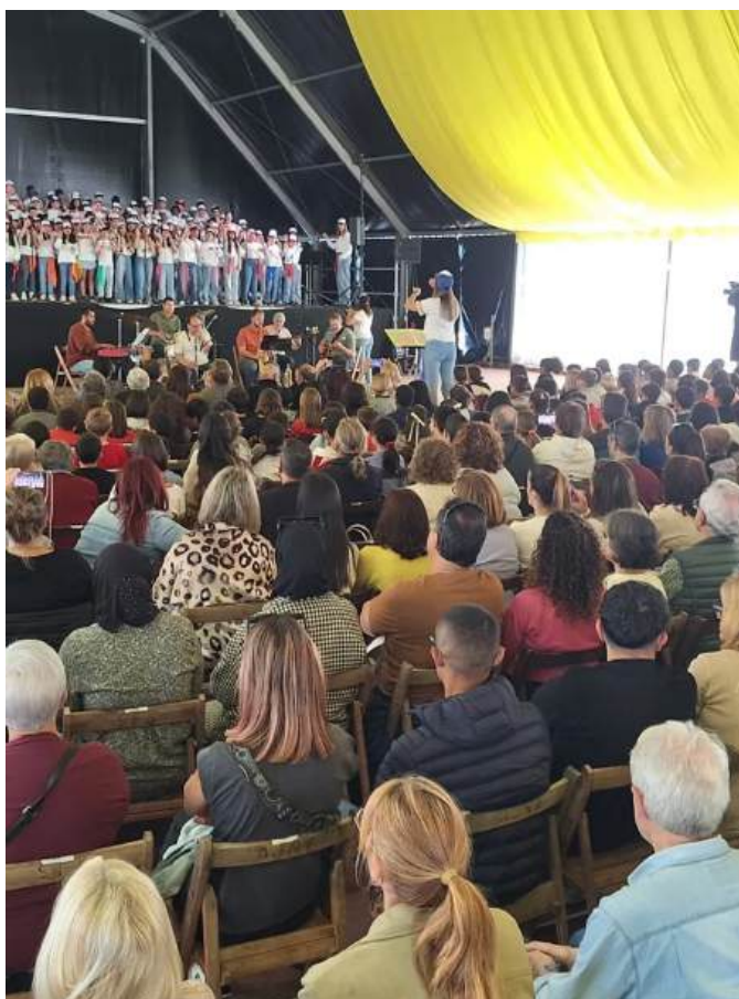
Alumnes de les Escoles de Primària de Sant Feliu de Guíxols durant la Cantaescola al Guíxols Arena