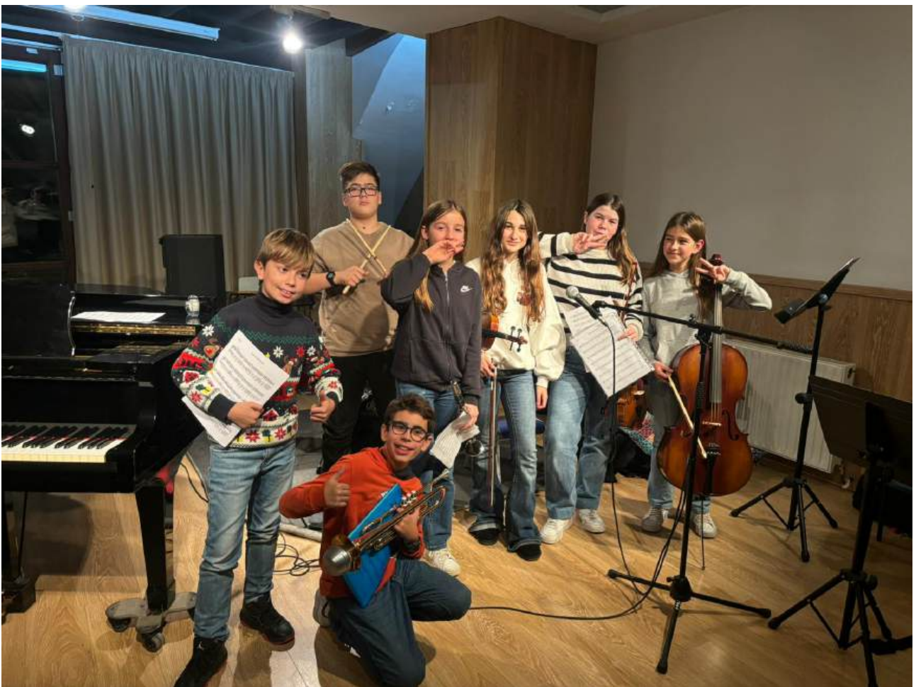
Alumnes participants al concert de combos a l'Auditori de l'Escola de Música

Per tal de donar un espai als grups de música moderna de l'EMMú, els professors encarregats dels combos van organitzar aquesta activitat a l'Auditori de l'Escola de Música, on hi van participar els alumnes de Formació Avançada i Nivell Mitjà, així com alumnes lliures. Una activitat nova que va ser molt profitosa per a tothom.