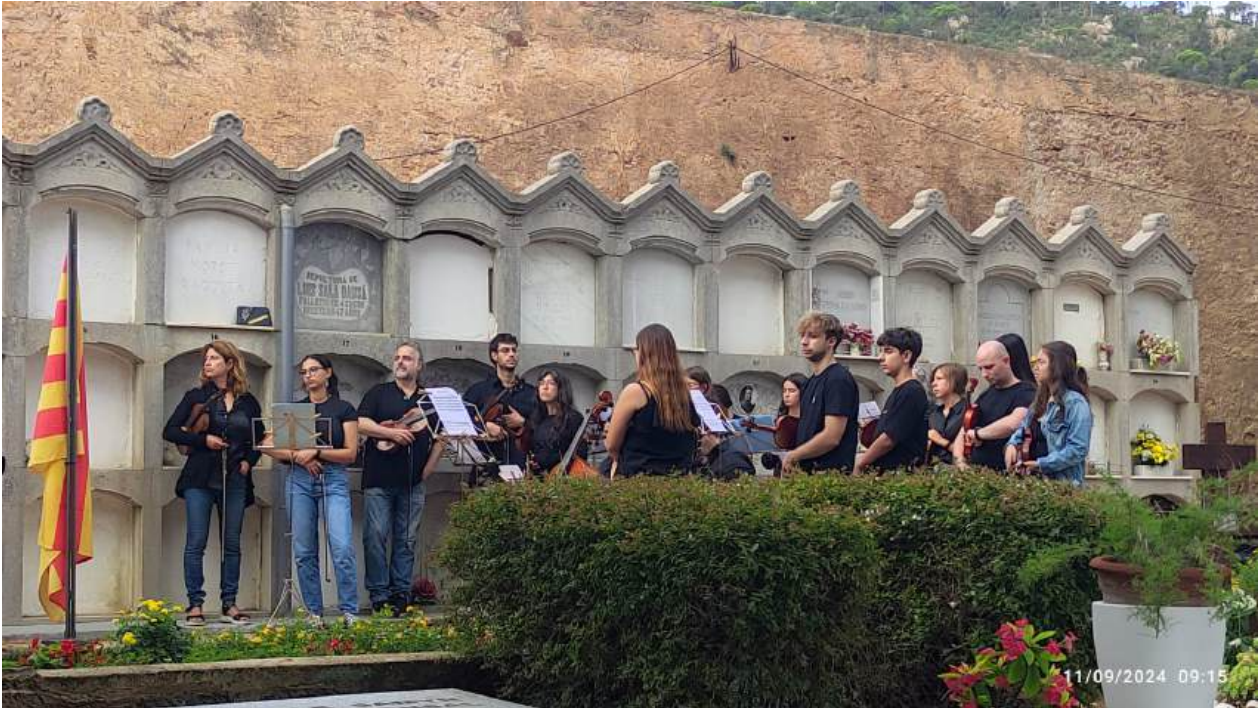
Alumnes de l'orquestra de corda de l'EMMú Guíxols Vall d'Aro abans de començar l'acte

L'Orquestra de Corda de la EMMú Guíxols Vall d'Aro va participar a l'acte institucional el dimecres 11 de setembre, interpretant "El Cant dels Ocells" i "Els Segadors" davant la tomba del president Josep Irla al cementiri de Sant Feliu de Guíxols.