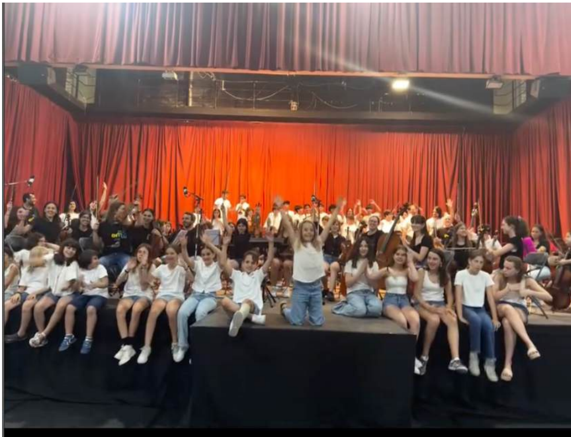
Alumnes de les tres escoles de l'EMMú Guíxols Vall d'Aro al finalitzar el concert al pavelló de Platja d'Aro

Tot i que aquest concert es va realitzar al pavelló de Platja d'Aro, els alumnes de l'Escola de Sant Feliu de Guíxols, de l'Escola de Santa Cristina d'Aro i de l'Escola de Castell d'Aro, Platja d'Aro i S'Agaró van oferir un concert des dels grups de coral de Formació Bàsica 3 - 6 fins als alumnes de la coral de Formació Avançada i Nivell Mitjà, passant pels alumnes del Grup de Piano i Percussió, els Ensembles, l'Orquestra de Corda de petits i grans, la Marxing Band i l'Orquestra Simfònica. Un concert que dona una imatge global de gran part de les activitats que es realitzen a l'Escola de Música dels diferents municipis.