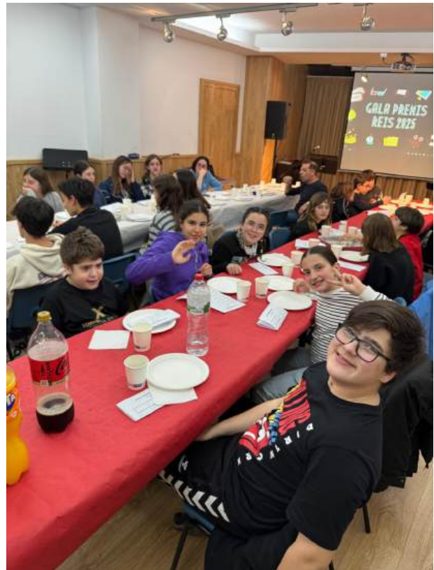
Alumnes i professors celebrant el sopar de germanor de la Marxing Band