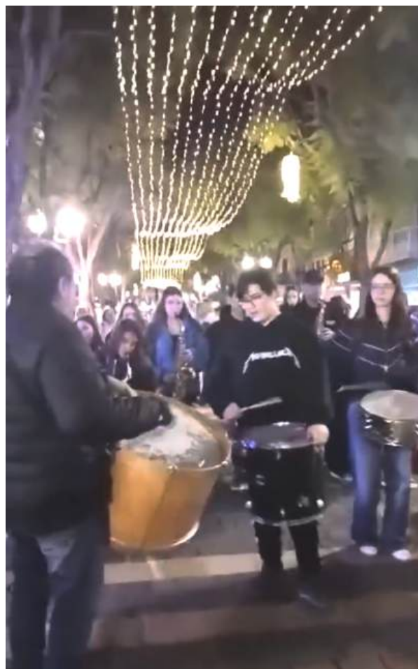
Alumnes de la Marxing Band de l'EMMú fent la rua de carnaval per Sant Feliu de Guíxols