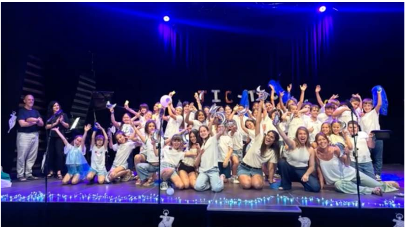
Alumnes de la Coral de Formació Bàsica 3 - 6 després del concert de final de curs a l’Espai Ridaura de Santa Cristina d’Aro

La van presentar al públic entre els alumnes de les tres escoles a l’Espai Ridaura de Santa Cristina d’Aro, on tota l’escola de música va estar decorada amb rellotges desfent-se gràcies a la temàtica que presentava l’obra: el temps i les presses amb què vivim el dia a dia.