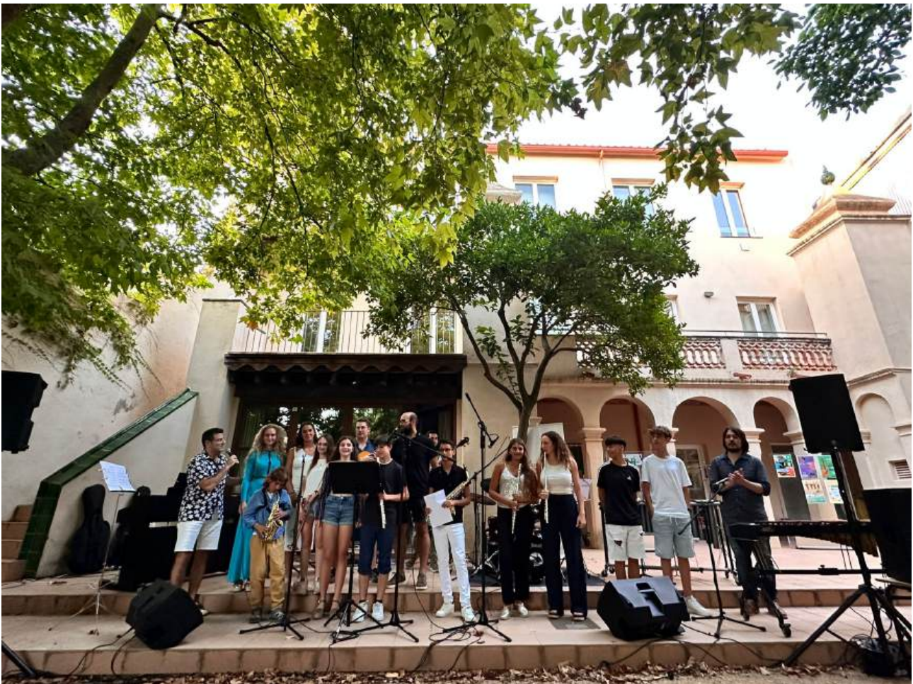
Alumnes participants al concert de combo del pati de l’Escola de Música

Amb motiu de l'anul·lació del “Dia de l’EMMú” del passat 22 de març, els alumnes de combo de l’Escola de Música, juntament amb combos de Palafrugell, l’Escola SarriArt i el Conservatori de Música de Girona es van trobar per realitzar un concert conjunt al pati de l’Escola de Música que va durar tota la tarda.