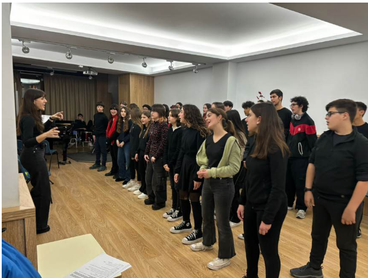
Alumnes de la Coral de Formació Avançada i Nivell Mitjà durant la classe de cant coral

Un cop corregits els exàmens, s'organitzen les reunions d'avaluació per tal que el professorat es pugui reunir en tres dies i parlar de cada alumne/a. Alhora, es demana a tots els professors que redactin els informes d'avaluació per tal de poder-ho fer arribar a les famílies.