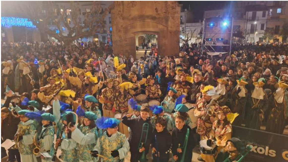
Alumnes de la Marxing Band disfressats de patges reials a la plaça del Monestir de Sant Feliu de Guíxols al finalitzar la rua de Reis 2025

Aquest curs s'ha repetit la participació dels alumnes de la Marxing Band, del Grup de Vent i de Percussió a participar a la Rua de Reis. Els alumnes queden a les 16:30h al pati de l'Escola de Música per assajar les cançons de la rua de memòria, es vesteixen de patges i surten des del Guíxols Arena per anar seguint tot el recorregut pel municipi fins arribar davant del Monestir, on toquen per darrera vegada i donen pas als discursos dels Reis d'Orient.