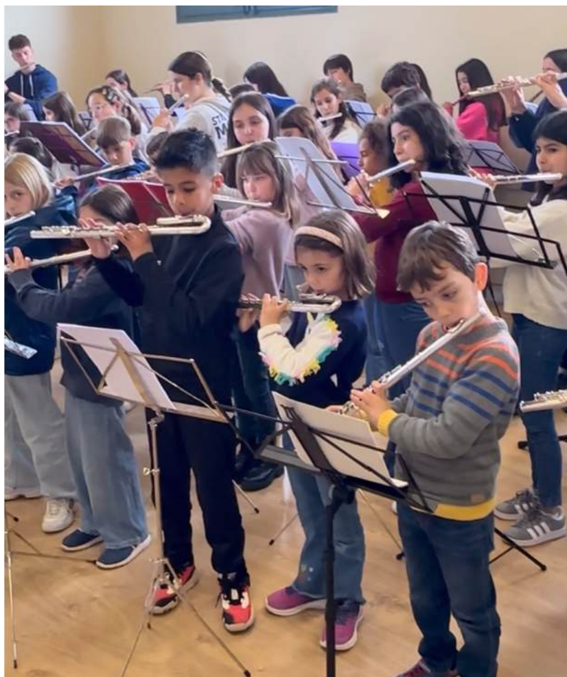
Assaig de la peça conjunta dels alumnes de la XXI Flautada a l'Escola de Música de Torroella de Montgrí

La jornada va finalitzar amb un concert a l'Espai Ter de Torroella de Montgrí, on els flautistes van interpretar obres de música de cambra per nivells i van oferir dues peces conjuntes, oferint a les famílies l'oportunitat d'escoltar peces amb alumnes des dels 6 anys fins als adults.