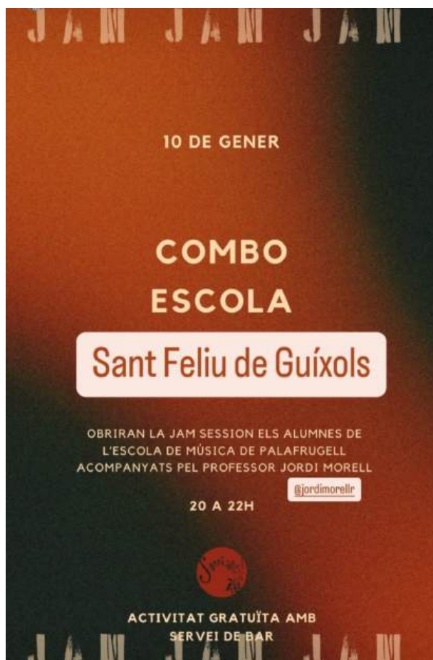
Cartell de l'activitat de combo dels alumnes de l'EMMú Guíxols Vall d'Aro amb els alumnes de l'Escola de Música de Palafrugell

En aquest cas ha estat la participació dels alumnes adults que fan música moderna, anant a tocar a la JAM Sessió de l’Escola de Música Sarriart.